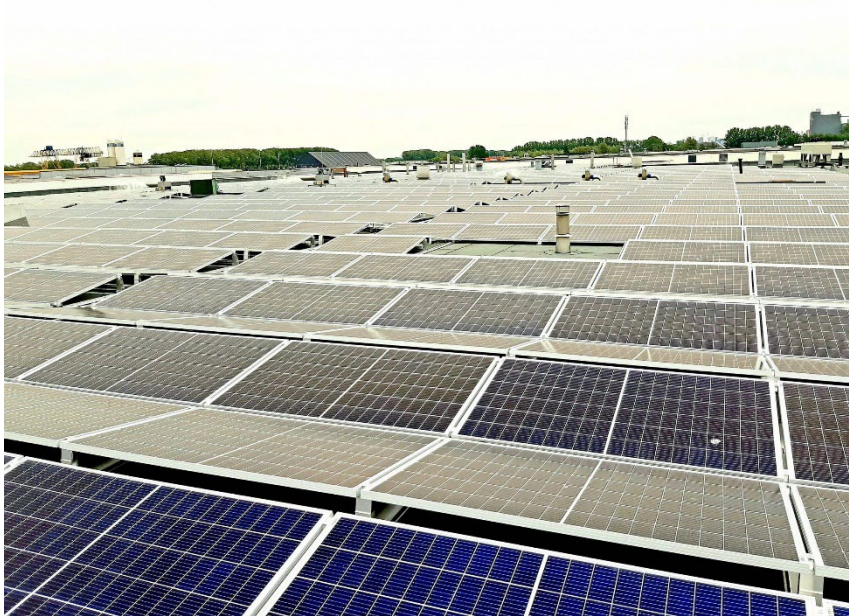
Het Zonnestroomsysteem Ruitenburg dat onderdeel is van de Portefeuille Zonnestroomsystemen

Aan de Zonnestroomsystemen is een SDE beschikking toegekend en alle Zonnestroomsystemen zijn reeds operationeel. Drie Zonnestroomsystemen zijn gelegen in de provincie Limburg en een Zonnestroomsysteem in Utrecht.